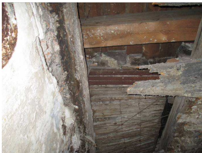
Propadlý zákop chodby před dveřmi z místnosti 1.11

Z uvedeného důvodu doporučujeme s ohledem na bezpečnost návštěvníků v uvedeném místě ihned zabránit pohybu osob pod stropem i na něm , což platí i pro současně užívanou obchozí prohlídkovou trasu přes lampovnu. Strop pod chodbou před dveřmi z místnosti 1.11 má rovněž propadlý zákop, který se opírá o zcela destruovaný trám podhledu. Strop je i zde v havarijním stavu, protože nosná konstrukce prakticky chybí. Její funkci plní pouze nevyztužená betonová vrstva podlahy svým klenebným účinkem. Tloušťka betonu je pouze cca 0,09m.