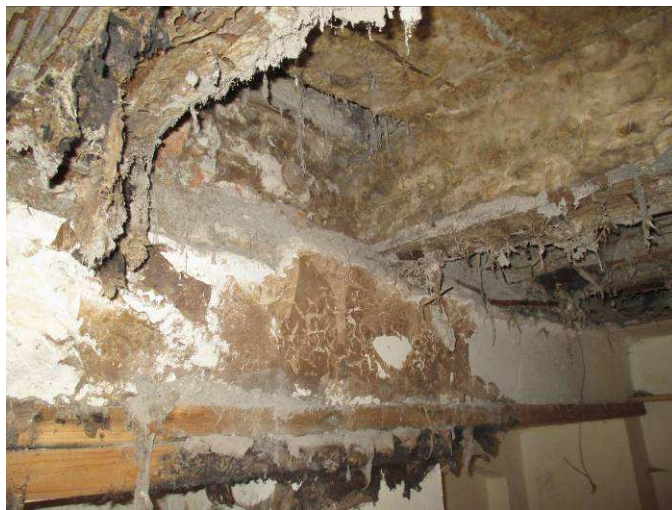
Zničený strop pod chodbou 1.9

Závěrem znovu upozorňujeme na nebezpečí zřícení části stropu a na nutnost zajistit bezpečnost osob zamezením vstupu. Špatný technický stav konstrukce neumožňuje v daném místě podle našeho názoru ani její provizorní podepření a k havárii stropu může dojít náhle bez předchozích varovných příznaků.. Výsledky průzkumu včetně dokumentace sond a výsledků laboratorního mykologického posouzení odebraných vzorků dřeva budou uvedeny v následné podrobné zprávě.